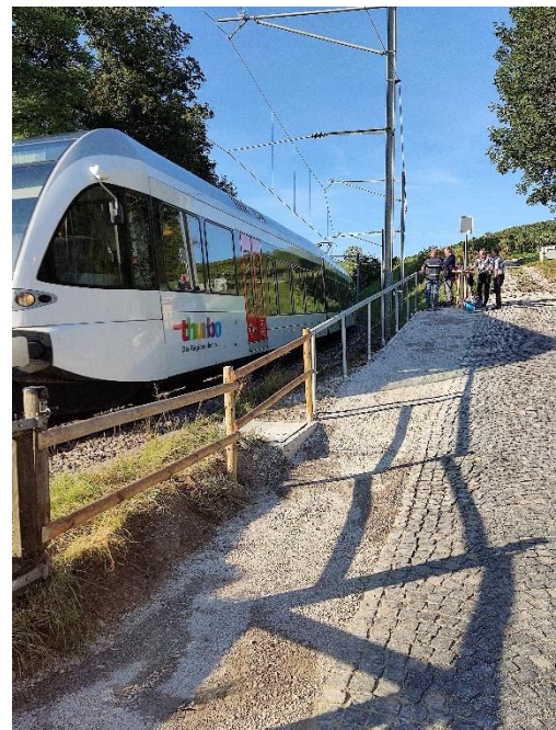
Weg beim Bahnwärterhäuschen