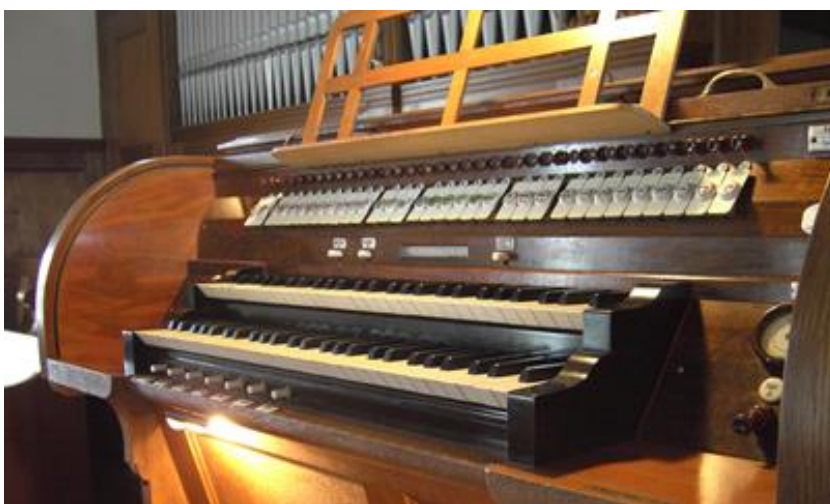
Die Ossinger Orgel hat 140 Tasten, 11 Tritte, 73 Registerklappen und -züge und 10 Knöpfe, insgesamt 230 Bedienungselemente und somit mehr als im Cockpit eines Jumbo-Jets. Sie ist ein wahres Wunderwerk der Technik und funktioniert ohne jegliche Elektronik.

An diesem Konzert im Rahmen des Jubiläums „100 Jahre Ossinger Orgel“ werden Kinder und Erwachsene eine unterhaltsame, abwechslungs- und zugleich lehrreiche Stunde erleben. (pps)