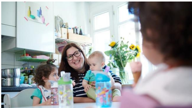
Individuell und flexibel: Kundenbetreuung in Tagesfamilien

im Kanton Zürich steht mit dem Standard ein fachlich anerkanntes Qualitätsentwicklungsinstrument zur Verfügung, das als Grundlage für die qualitätsfördernde Finanzierung genutzt werden kann.