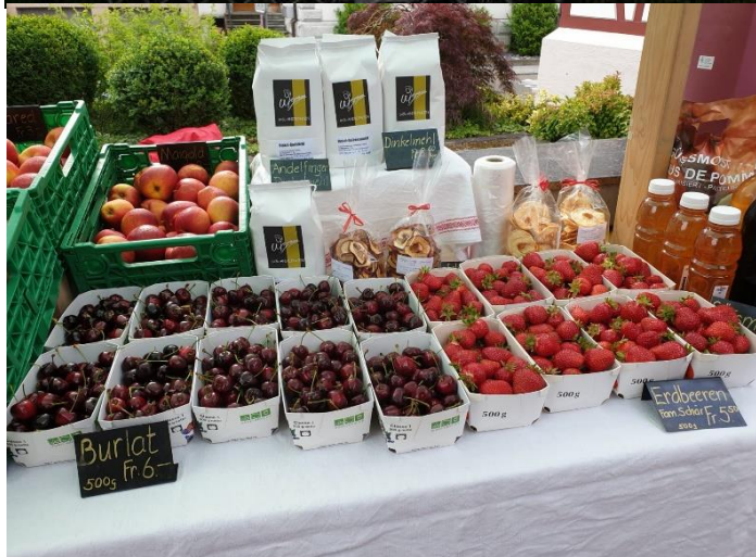
Rückblick Bauernmarkt 2023