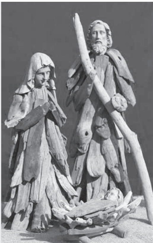
Ausstellung auf dem Bauernhof

Verbringen Sie einige Stunden im Advent inmitten vieler Weihnachtskrippen aus aller Welt und lassen Sie sich einstimmen auf Weihnachten, der Geburt Jesus. Sie werden staunen über das handwerkliche Geschick der Krippenkünstler aus jedem Kontinent. Sammeln Sie selber Ideen zum Gestalten einer eigenen Weihnachtskrippe. Es erwarten Sie ausgestellte Krippenfiguren in einer alten Scheune, im Wöschhüsli und in Holz-Hochsilos.