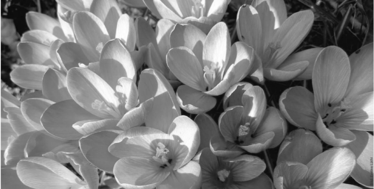
Gemeinschaftliches Erblühen im Frühling (Krokusse)